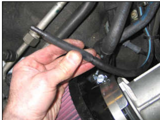
Fig. # 21