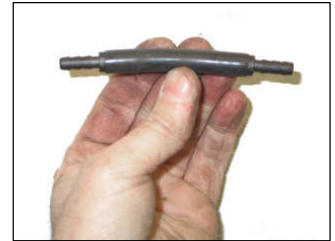
Fig. # 20