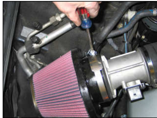
Fig. # 18