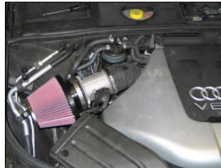
Fig. # 23