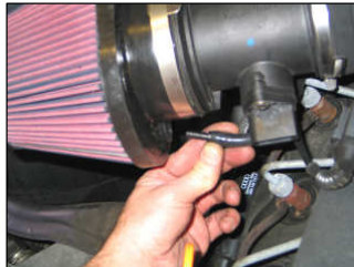
Fig. # 22