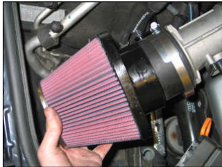
Fig. # 17