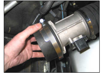
Fig. # 16