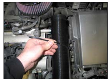
Fig. # 8