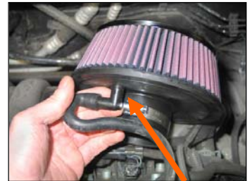
Fig. # 4