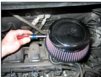
Fig. # 5