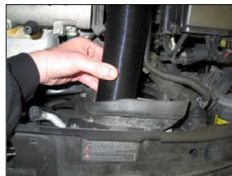
Fig. # 7