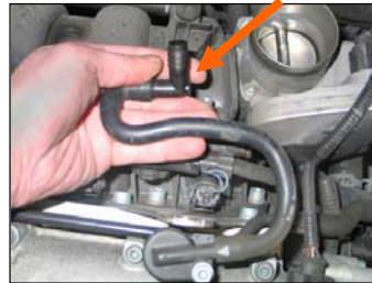
Fig. # 3