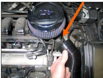
Fig. # 9