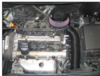
Fig. # 10