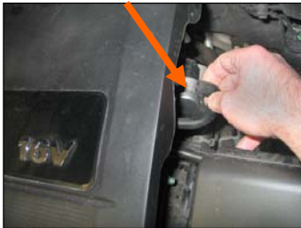
Fig. # 1

FILTER MAINTENANCE: K&N suggests checking the filter periodically for excessive dirt build-up. When the element becomes covered in dirt (or once a year), service it according to the instructions on the Recharger service kit available from your K&N dealer, part number 99-5000 or 99-5050.