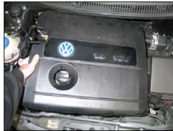
Fig. # 2