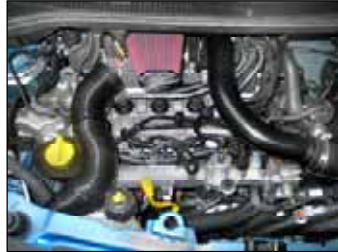
Fig. # 18