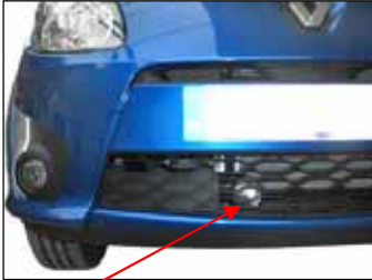
Fig. # 17