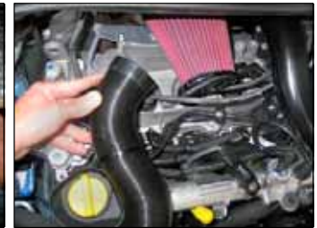
Fig. # 16