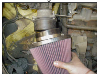
Fig. # 11