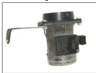
Fig. # 6