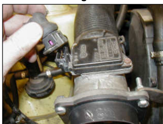
Fig. # 9