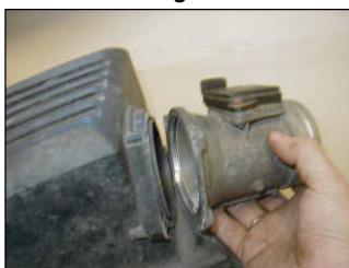
Fig. # 5