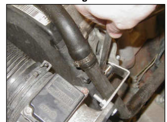
Fig. # 8