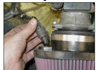
Fig. # 12