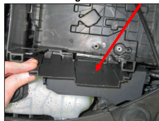
Fig. # 7