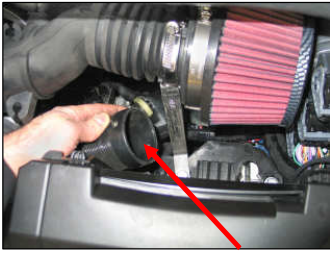
Fig. # 21