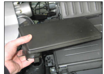
Fig. # 4