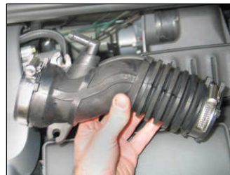
Fig. # 3