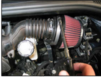
Fig. # 18