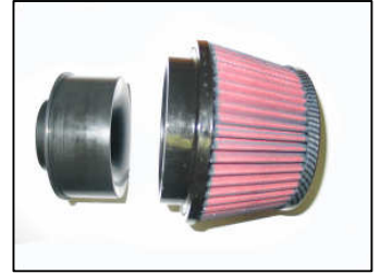
Fig. # 16