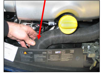
Fig. # 20