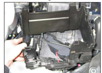
Fig. # 8