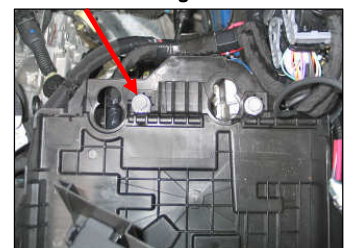
Fig. # 12