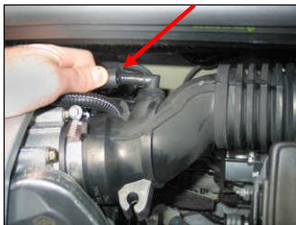
Fig. # 1

FILTER MAINTENANCE: K&N suggests checking the filter periodically for excessive dirt build-up. When the element becomes covered in dirt (or once a year), service it according to the instructions on the Recharger service kit available from your K&N dealer, part number 99-5003EU.