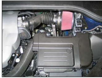
Fig. # 22