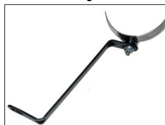
Fig. # 11