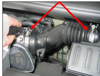
Fig. # 2