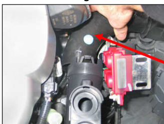
Fig. # 9