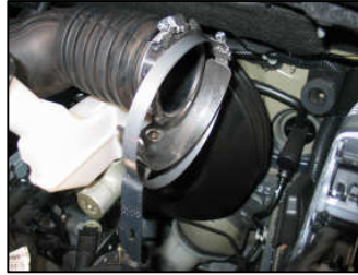
Fig. # 15