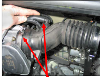
Fig. # 14