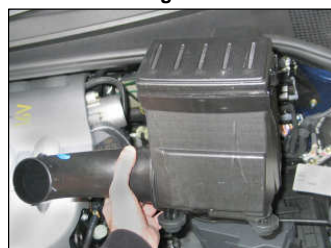
Fig. # 10