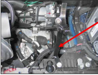
Fig. # 13