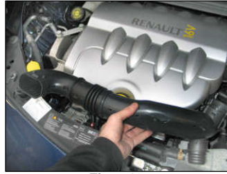
Fig. # 19