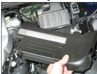
Fig. # 5